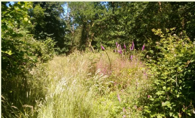
Ffigur 5: Afon Gwaun, yr un safle ym mis Gorffennaf 2018

O fis Mawrth 2018 ymwelwyd â'r safle ddwywaith y mis. Erbyn mis Gorffennaf y cyfan oedd ar ôl oedd un neu ddau blanhigyn slei.