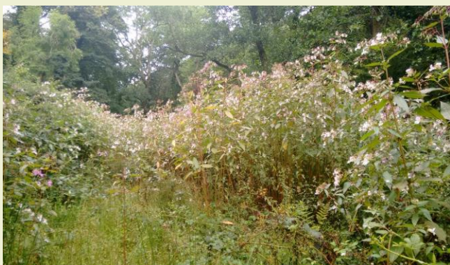
Ffigur 4: Jac y Neidiwr ar Afon Gwaun ym mis Awst 2017

Mae gwaith rheoli Jac y Neidiwr ar y gweill ar oddeutu 9 hectar yn y dalgylch, sy'n amrywio o ran mathau o gynefin. Tynnwyd y lluniau isod ar yr Afon Gwaun ac maent yn dangos enghraifft wych o sut y gall pwyth mewn pryd ddatrys y broblem.