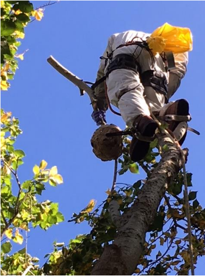
Ffigur 2 Rheoli Cacwn Asia

Ni welwyd Cacwn Asia yn y DU ers y 14eg Hydref. Mae'r perygl o ganfod nyth cacwn Asia byw yn y DU yn fach iawn bellach gan nad yw cacwn Asia yn actif yn ystod misoedd oer y gaeaf. Mae perygl o hyd y bydd brenhines Cacwn Asia yn cael ei chludo'n ddamweiniol.