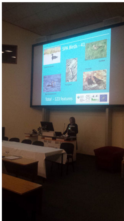
Cyflwyniad LIFE Natura 2000