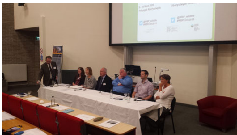
Trafodaeth banel Diwrnod 1

CL: Mae'n bwysig cynnwys y sector preifat hefyd.