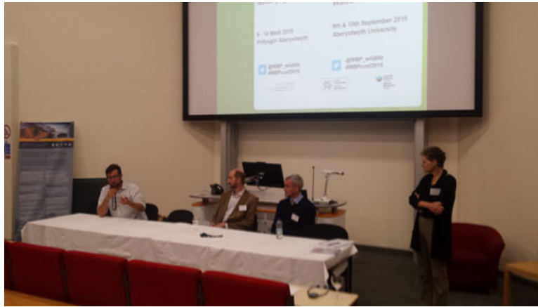
Trafodaeth banel ar wyddoniaeth dinasyddion